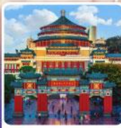
ศาลาประชาคมฉงชิ่ง