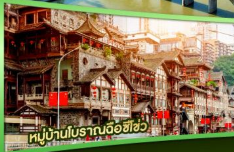
หมู่บ้านโบราณฉือฮิว

ไปเที่ยวฮิลลี่ ฉงชิ่ง 5 วัน 4 คืน เฉียนเจียง อุ๋หลง