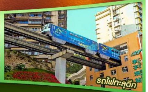
รถไฟฟ้าชุดัก