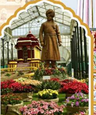
บังกาลอร์