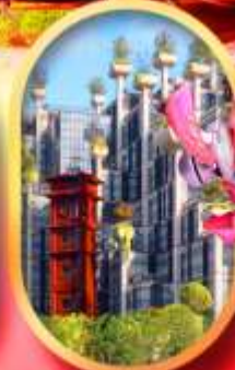
อาคารพันดับไม้