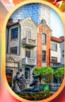
ย่านซินเกียนตี้