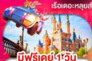
มีฟรีเคย์ 1 วัน