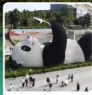
รูปปั้นหมีแพนด้าเซสพี