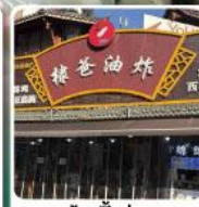
ร้านปังย่างของพ่อหวังเหอดี