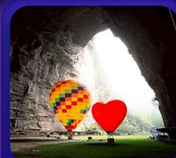
“ ถ้าถึงหลง ”

T2G-CKG29FD ลงชิง เอ็นจีโอ...ถ้าถึงหลง ล่องเรือมังกรกั๋งสูย ผิงซานแกรนด์แคนย่อน 5D 4N (FD)