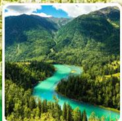
ทะเลสาบคานาสี