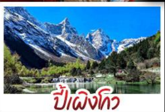
ป่าผิงโกว