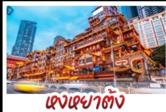
เฉิงเฉิงเฉิง

อุทยานหลุมบ่อฟ้า - อุทยานเขานางฟ้า หงหยาดัง - นั่งรถไฟทะเลสาบ - อุทยานสี่ดรุณี ป่าผิงโกว - สะพานหนานเฉียว