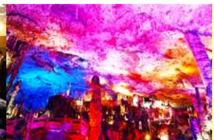
เก้าเก้าสวรรค์จิวเกียนต้ง