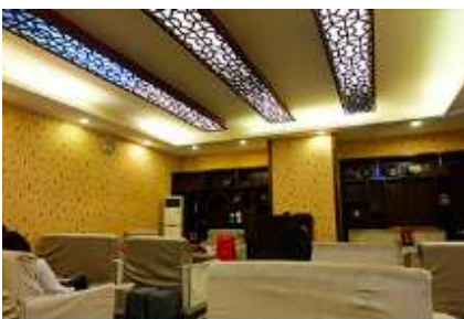
ศูนย์แพทย์แผนจีน

อัตราค่าบริการสำหรับโปรแกรมเสริมการแสดงชุด The love Story of Wooden man and Fairy Fox ท่านละ 400 หยวน (หรือประมาณ 2000.-บาทขึ้นอยู่กับอัตราแลกเปลี่ยน) ระยะเวลาที่ใช้ในการเที่ยวชมการแสดง ประมาณ 3 ชั่วโมง รวมเวลาเดินทางไปกลับค่าบริการรวม ค่าบัตรเข้าชม ค่ารถรับ ส่ง และค่าน้ำเที่ยวของไกด์ท้องถิ่น