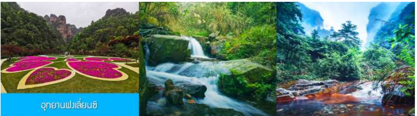
อุทยานฟงเลียนซี