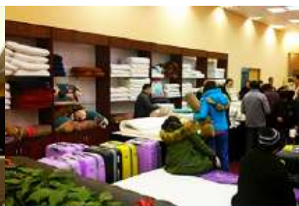
ศูนย์จำหน่ายผลิตภัณฑ์ยาพารา