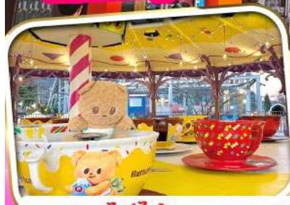
พลาดไม่ได้! BUTTERBEAR X FUJI-Q