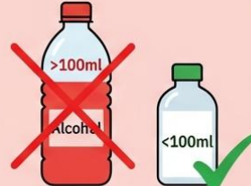
ของเหลว/แอลกอฮอล์เกิน 100 มิลลิลิตร