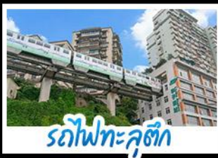
รถไฟทะเลสาบ

แกรนด์แคนยอนผิงซาน หมู่บ้านโบราณฉือซีไช่ รถไฟทะเลสาบ หงหยาดัง อุทยานด่านสิงห์ นั่งรถไฟความเร็วสูง