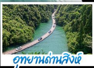
อุทยานด่านสิงห์