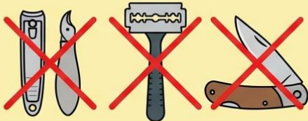
กรรไกรตัดเล็บ (Nail Clippers) มีดโกน (Razor) มีดพับ (Folding Knife)