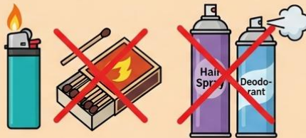
ไฟแช็ก, ไม้ขีดไฟ (Lighter, Matches) สเปรย์หรือกระป๋องอัดแก๊สทุกชนิด