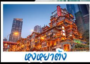
แสงสถาปัตย์