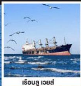
เรือลู เวย์ส์