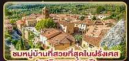
ชมหมู่บ้านที่สวยงามที่สุดในฝรั่งเศส (มูสติเยแซงมาร์)