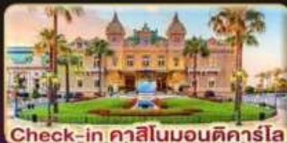
Check-in คาสีโนมอนติคาร์โล