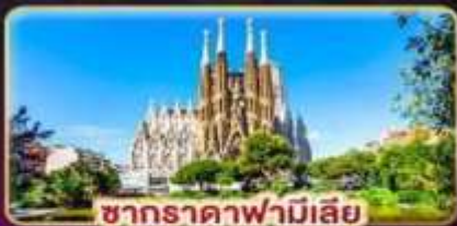
ซากราดาฟามีเลีย

สัมผัสเสน่ห์ลาเวนเดอร์ "โปรวองซ์" แห่งฝรั่งเศสใต้