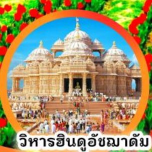
วิหารอินดูอัชมาดัม