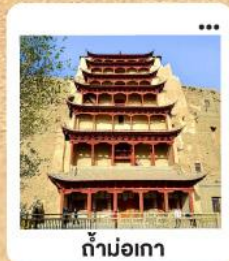
ต้าม่อเกา