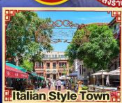
Italian Style Town