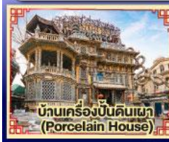
บ้านเครื่องปั้นดินเผา (Porcelain House)