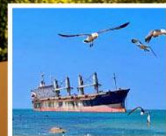
เรือสินค้าเกย์ตันบลูอิส