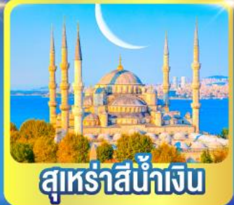
สุหรัสน้ำเงิน