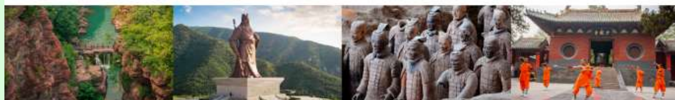
อุทยานสวรรค์หยุนโตซาน