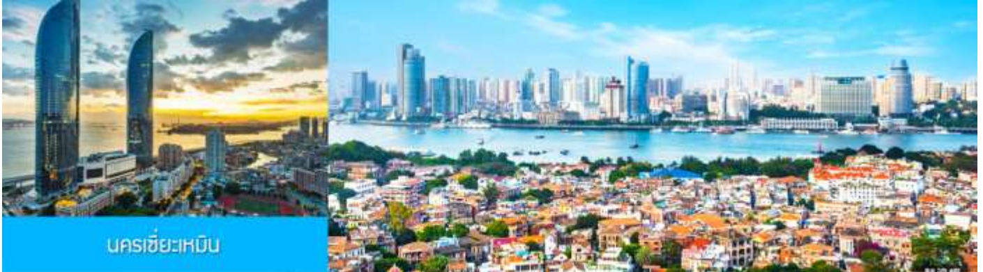
นครซีอะเหมิน

23.30 น. คณะเดินทางพร้อมกันที่ ท่าอากาศยานสุวรรณภูมิ อาคารผู้โดยสารขาออกชั้น 4 ประตูหมายเลข 10 เคาน์เตอร์ เช็คอิน สายการบิน XIAMEN AIRLINES (MF) เจ้าหน้าที่บริษัทฯ คอยให้การต้อนรับและอำนวยความสะดวกในการเช็คอิน