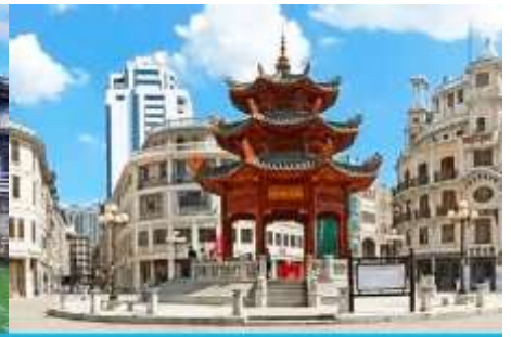
ย่านเมืองเก่าซัวเถา