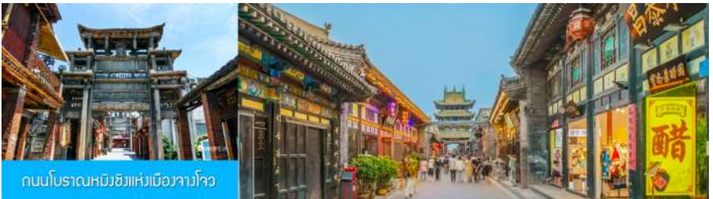
ถนนโบราณหมิงชิงแห่งเมืองจางโจว

หลังอาหารเช้าท่านเดินทางสู่เมือง จางโจว นำชม ถนนโบราณหมิงชิงแห่งเมืองจางโจว 漳州明清古街 ถนนสายนี้ถูกสร้างขึ้นในราชวงศ์หมิงอายุราว 300 ปี สองข้างถนนเต็มไปด้วยอาคารบ้านเรือนโบราณ ที่อดีตเคยเป็นสถานที่สำคัญของเมืองจางโจว อาทิ ศาลหลักเมือง จวนผู้ว่าเมือง ชุมประตูดินโบราณ ฯลฯ