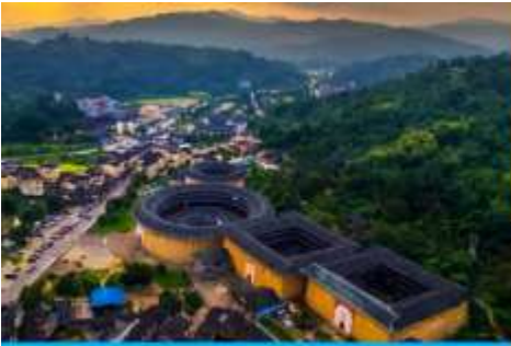
บ้านดินโบราณคูโหลวกาเปย์

เจิงฉีโหลว หู่หยุนโหลว ซื่อเจ้อโหลว ฯลฯ ได้รับสมญานามว่าเป็น ราชาแห่งบ้านดิน กลุ่มบ้านดินหลายหลังนี้เป็นบ้านพักอาศัยของชาวจีนและตระกูลเจียง 江氏 นำท่านเที่ยวชม บ้านดินเจิงฉีโหลว 承启楼