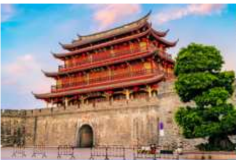
เมืองโบราณเต๋อจิว

พักที่ โรงแรม HAKKA TULOU PRINCE HOTEL 4* หรือเทียบเท่าในเมืองหย่งตั้ง