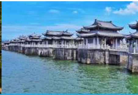
สะพานเซียงจื่อเจียว