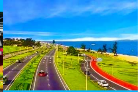
ถนนหวนเต่าลู่