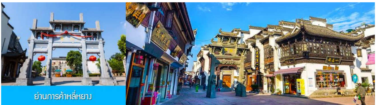
ย่านการค้าลี่หยาง