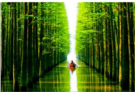
สวนป่าไม้ลอยน้ำชิงซานหู

พักที่ PAIJING HOLIDAY HOTEL โรงแรมระดับ 4 ดาวท้องถิ่น หรือเทียบเท่า เมืองหวงซาน