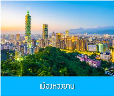
เมืองหวงซาน