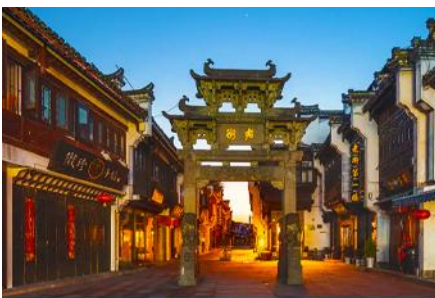
ถนนโบราณกุนซีเหล่าเจีย

หลังอาหารนำท่านนำท่านเที่ยวชม หมู่บ้านโบราณหงซุน 宏村 หมู่บ้านโบราณขึ้นชื่ออายุกว่า 800 ปีที่ได้รับการขึ้นทะเบียนจาก UNESCO ชมบ้านเรือนโบราณกว่า 140 หลัง ที่สร้างขึ้นในยุคราชวงศ์หมิงและราชวงศ์ชิง ที่ยังอยู่ในสภาพที่สมบูรณ์ นำท่านเที่ยวชม และเช้คอิน ณ จุดเช้คอินต่าง ๆ ภายในหมู่บ้าน อาทิ บึงน้ำพระจันทร์ ทะเลสาบหนานหู โรงเรียนหนานหู หอบรรพบุรุษ คลองน้ำหงซุน ต้นไม้โบราณ ฯลฯ