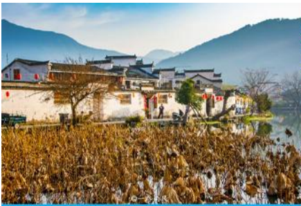
หมู่บ้านโบราณหงซุน

ไกด์ท้องถิ่นนำเสนอโปรแกรมทัวร์เสริมบัตรชมการแสดงชุดตำนานรักเมืองซ่ง 宋城千古情 การแสดงภายในโรงละครที่ดีที่สุด และได้รับรางวัลมากที่สุดของประเทศจีนจีน.....อัตราค่าบริการสำหรับโปรแกรมเสริม ท่านละ 380 หยวนหรือ 1,900 บาท ใช้เวลาประมาณ 90 นาที ค่าบริการรวม ค่าตัวชมการแสดง ค่ารถบัสรับ และค่าน้ำดื่มของไกด์ท้องถิ่น