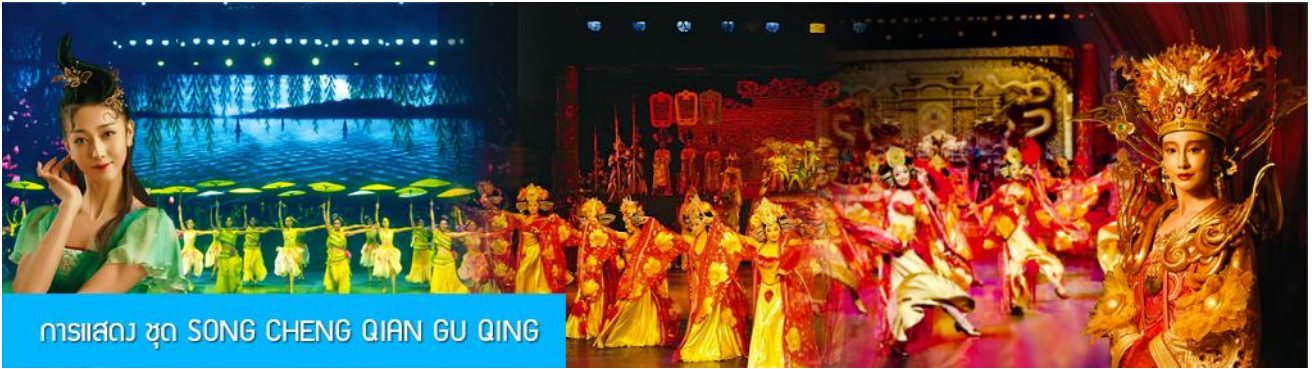
การแสดง ชุด SONG CHENG QIAN GU QING

ไกด์ท้องถิ่นนำเสนอโปรแกรมทัวร์เสริมบัตรชมการแสดงชุดตำนานรักเมืองซ่ง 宋城千古情 การแสดงภายในโรงละครที่ดีที่สุด และได้รับรางวัลมากที่สุดของประเทศจีนจีน.....อัตราค่าบริการสำหรับโปรแกรมเสริม ท่านละ 380 หยวนหรือ 1,900 บาท ใช้เวลาประมาณ 90 นาที ค่าบริการรวม ค่าตัวชมการแสดง ค่ารถบัสรับ และค่าน้ำดื่มของไกด์ท้องถิ่น