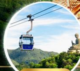
รวมกระเช้าฮ่องกง