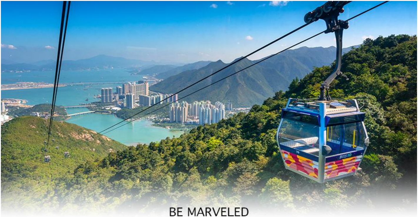
BE MARVELED กระเช้ามองปีง

ของอุทยานบนเกาะลันเตาเหนือ ถือได้ว่าเป็นแหล่งท่องเที่ยวอันมีเอกลักษณ์ระดับโลกของฮ่องกง (**กรณี กระเช้ามองปีง 360 มีการปิดซ่อมบำรุง หรือ มีการปิดเนื่องจากสภาพอากาศแปรปรวน ทางบริษัทฯ ขอสงวน สิทธิ์ในการเปลี่ยนเป็นใช้รถโค้ชของทางอุทยานในการเดินทาง เพื่อนำท่านขึ้นสู่หมู่บ้านวัฒนธรรมมองปีง บน เกาะลันเตาแทน**) จากนั้นนำท่านไปสักการะ (พระใหญ่เกาะลันเตา หรือ พระพุทธรูปเทียนถาน (TIAN TAN BUDDHA STATUE))