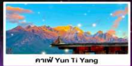
คาเฟ่ Yun Ti Yang