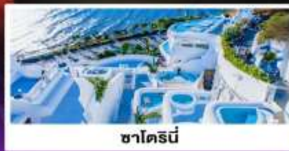
ซาโตรนี่