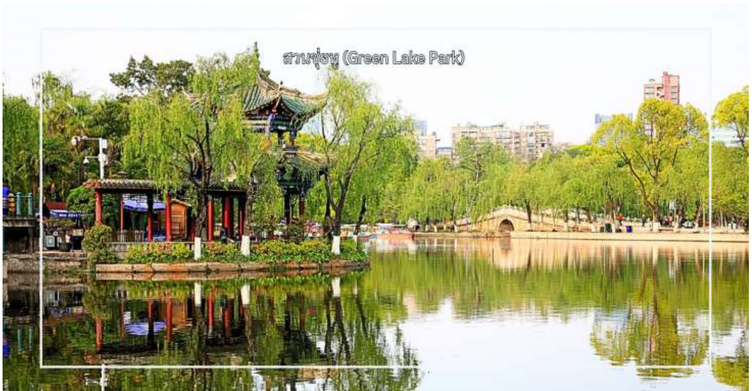
สวนชู่หู (Green Lake Park)

จากนั้นนำท่าน ชมทัศนียภาพ สวนชู่หู (Green Lake Park) เป็นสวนสาธารณะใจกลางเมืองคุนหมิงที่มีชื่อเสียงและได้รับความนิยมอย่างมาก โดดเด่นด้วยทะเลสาบสีเขียวมรกตที่โอบล้อมด้วยต้นไม้ร่มรื่น และบรรยากาศผ่อนคลาย เหมาะแก่การพักผ่อนและเดินเล่น สวนแห่งนี้เป็นศูนย์รวมวิถีชีวิตของชาวคุนหมิง นักท่องเที่ยวสามารถชมกิจกรรมท้องถิ่น สัมผัสบรรยากาศธรรมชาติ และถ่ายภาพความสวยงามของสวนในทุกฤดูกาล