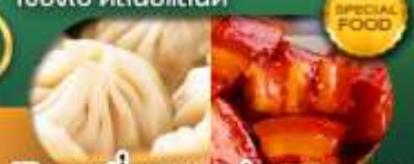
พิเศษ เสี่ยวหลงเป่า หมูตงพอ เดินทาง ม.ค. - มิ.ย. 69