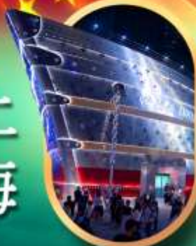
เรือคอะหลุยส์