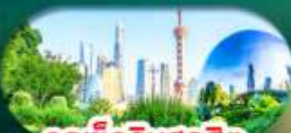
จุดเช็กอินสุดฮิต North Bund Shanghai

เซี่ยงไฮ้ หางโจว ล่องทะเลสาบซีหู ฟรีคีย์