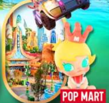
เลือกซื้อทัวร์เสริม เซี่ยงไฮ้ ดิสนีย์แลนด์

เซี่ยงไฮ้ หางโจว ล่องทะเลสาบซีหู ฟรีคีย์