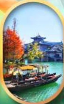
เมืองโบราณผู้หยวน