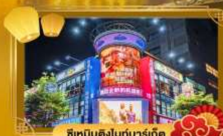
ช้อปปิ้งไนท์มาร์เก็ต