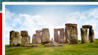
เยือนสโตนเฮ็นจ์ และ พิพิธภัณฑน์โรมันบาร