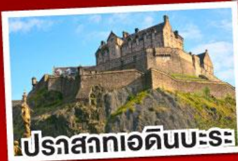
ปราสาทเอдинบะระ