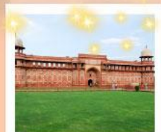
Ajmer Sharif Dargah