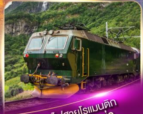
รถไฟสายโรแมนติก ฟลิมส์บาน่า