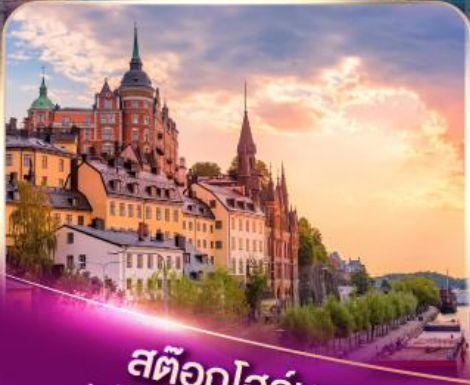
สต็อกโฮล์ม เวนิสแห่งยุโรปเหนือ