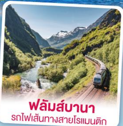
ฟลัมส์บานา รถไฟเส้นทางสายโรแมนติก