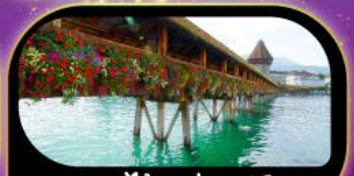
สะพานไม้ชาเปล ลูซิิร์น