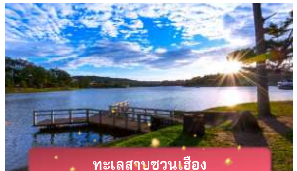
ทะเลสาบชวนเอียง

ที่พัก The Western Hill ระดับ 4 ดาวหรือเทียบเท่า