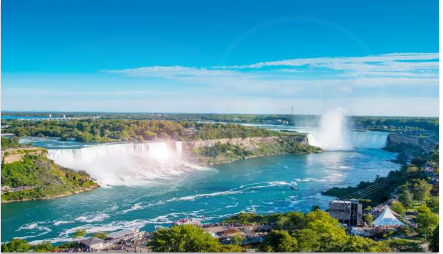
NIAGARA FALLS STATE PARK

นำท่านเดินทางสู่ “อุทยานแห่งชาติไนแอกการ่า” (Niagara Falls State Park) ฝั่งสหรัฐอเมริกา หนึ่งในสิ่งมหัศจรรย์ทางธรรมชาติของโลก ที่ได้รับการยกย่องให้เป็นสถานที่ท่องเที่ยวยอดนิยม และเป็นหนึ่งในสามจุดหมายปลายทางสุดโรแมนติกสำหรับการดื่มด่ำผืนพระจันทร์ของคู่บ่าวสาวชาวอเมริกัน น้ำตกไนแอก