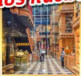
ร้านไอศกรีมมิยาฮาระ