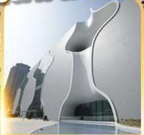
โรงละครโดง