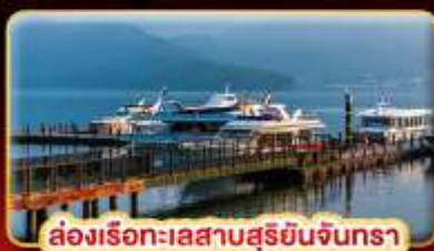
ล่องเรือทะเลสาบสุริยจันทร์

บ๊ี้แด้ม STREET FOOD แบบจุใจ ขอความรักวัดแดงชาแน