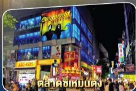
ตลาดซีเหมินตง