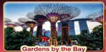
Gardens by the Bay