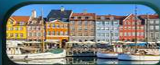
ย่านนูฮาวน์