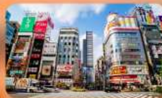
ซ้อปปิ้งชินจูกุ