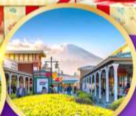
โกเทมบะ-พรีเมี่ยมเฮ้าส์

สนุกกับสวนสนุก FUJI-Q HIGHLAND พร้อมกับน้องหมีเนย BUTTERBEAR