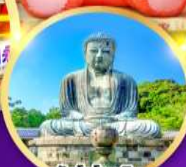
วัดโคโคคุอิน