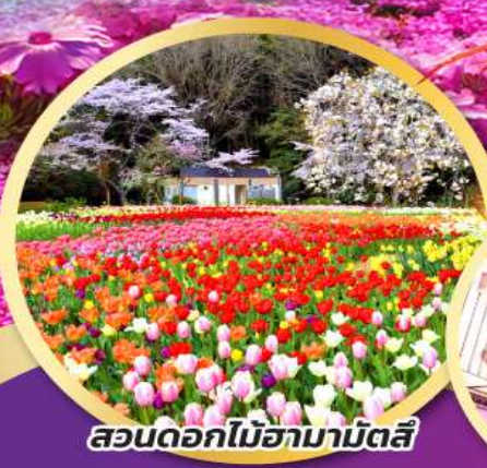
สวนดอกไม้ฮามามัตสึ