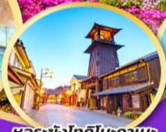
หอระขังโทคิโนะคานะ