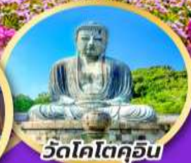
วัดโคโตคุอิน