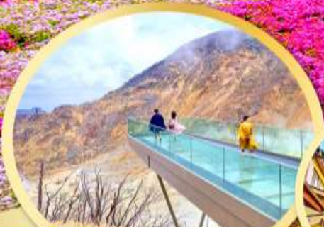
OWAKUDANI EARTH VALLEY