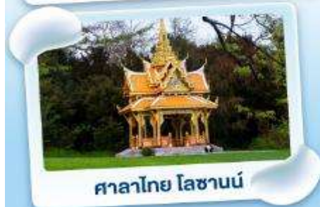
ศาลาไทย ไลซานน์