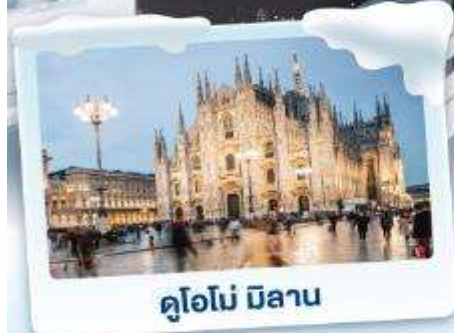
คูโอโม มิลาน