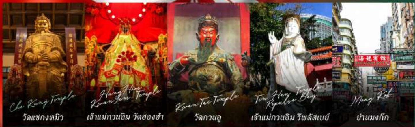
Che Kung Temple วัดแชกงงทมิว

รายการทัวร์ข้างต้นอาจมีการปรับเปลี่ยนเพื่อความเหมาะสม