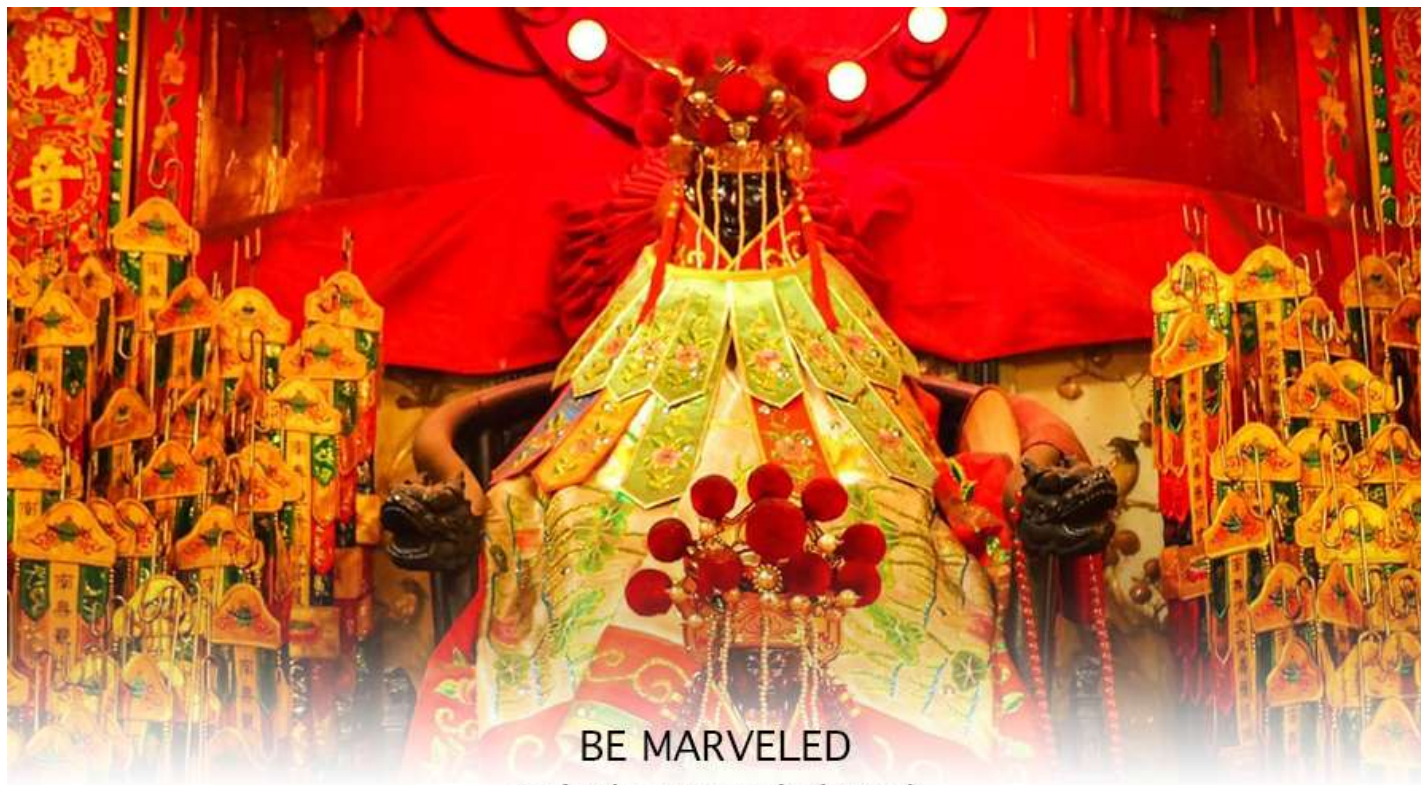
วัดเจ้าแม่กวนอิมฮองฮำ (ยิมเงิน)

ฉะนั้นการมาบูชาขอพรท่าน จะช่วยเสริมดวงไม่ให้เพลิงพล้ำแก่ศัตรู ทำให้มีมิตรที่ซื่อสัตย์ และคุ้มครองบริวารให้ก้าวหน้า และอยู่เย็นเป็นสุข ซึ่งผู้ประกอบอาชีพ ตำรวจ ทหาร และ นักการเมือง จึงมักจะนิยมบูชาเทพเจ้ากวนอู เป็นพิเศษ