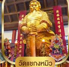
วัดแฉกงหมิว