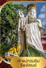
เจ้าแม่กวนอิม ริฟลิสซีย์