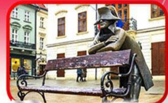
ย่านเมืองเก่าปราทิสลาวา

เที่ยวเมืองสวยริมทะเลสาบ ฮัลล์สตัดท์ • ชมเมืองไข่มุกแห่งโบฮีเมีย เซสกี กรุงลอน • ปราท • เวียนนา • ซอปปิงพาร์ตเนอร์สฟ เอาก์เล็ท