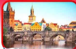
เขื่อนอินสพานชาร์ลส์