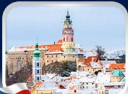
เมืองเซสท์ คุลมลอฟ