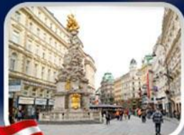
ช้อปปิ้งคาร์ทเนอร์สตรีก