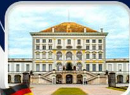
พระราชวังนิมเฟนบวร์ก