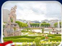
สวนมิรานา ซาลซ์บูร์ก