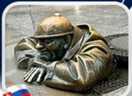
ประติมากรรม Cumil

มาเรียนพลาซซ์•บ้านเกิดโมสาร์ท•พระราชวังฮอฟบวร์ก•ซาลส์บวร์ก•บ้านเกิดโมสาร์ท•เกรโกเดร์สตรีก•ทะเลสาบคอนิกซ์•หมู่บ้านอัลส์สตัดท์•อนุสาวรีย์มาเรียเทเรซา