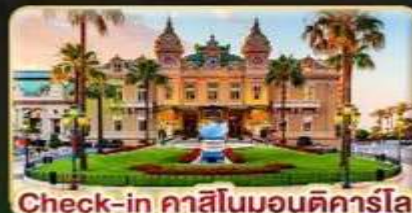
Check-in คาสิโนมอนติคาร์โล