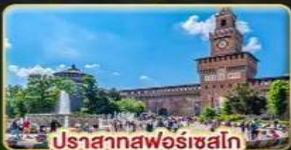
ปราสาทฟอรัสเซโก

📅 เดินทาง : 28 พ.ค. - 06 มิ.ย. | 05-14 ส.ค. 15-24 ต.ค. 69