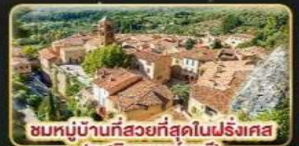
ชมหมู่บ้านที่สวยงามที่สุดในฝรั่งเศส (มูสติเยแซงก์มาร์)