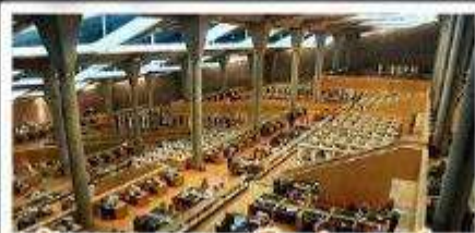
ห้องสมุดอเล็กซานเดรีย