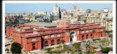
พิพิธภัณฑ์สถานแห่งชาติอียิปต์