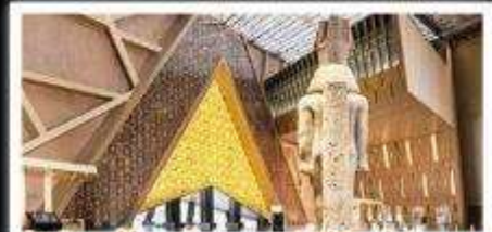
พิพิธภัณฑ์แกรนด์อียิปต์(GEM)

อารยธรรมลุ่มแม่น้ำไนล์ - พีรามิด - อเล็กซานเดรีย - เมมฟิส - ไคโร - โรงแรมระดับ 4 ดาว รวมค่าวีซ่า ตั๋วลuggage-เลกราย - อาหารครบทุกมื้อ