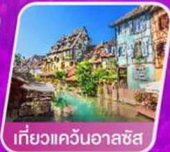
เที่ยวแคว้นอาลซัส