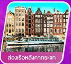
ส่องเรือสิงคารถะจก

เที่ยวเทศกาลดอกไม้เคอเคนฮอฟ ชมแคว้นอาลซัส หมู่บ้านสวยที่สุดในฝรั่งเศส เยือนเมืองมรดกโลก