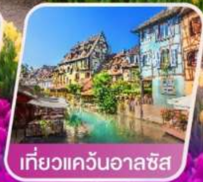
เที่ยวแคว้นอาลซัส