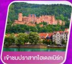
เข้าชมปราสาทไฮเดลเบิร์ก