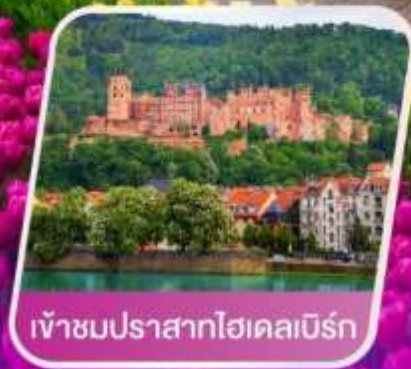
เข้าชมปราสาทไฮเคลมเบิร์ก